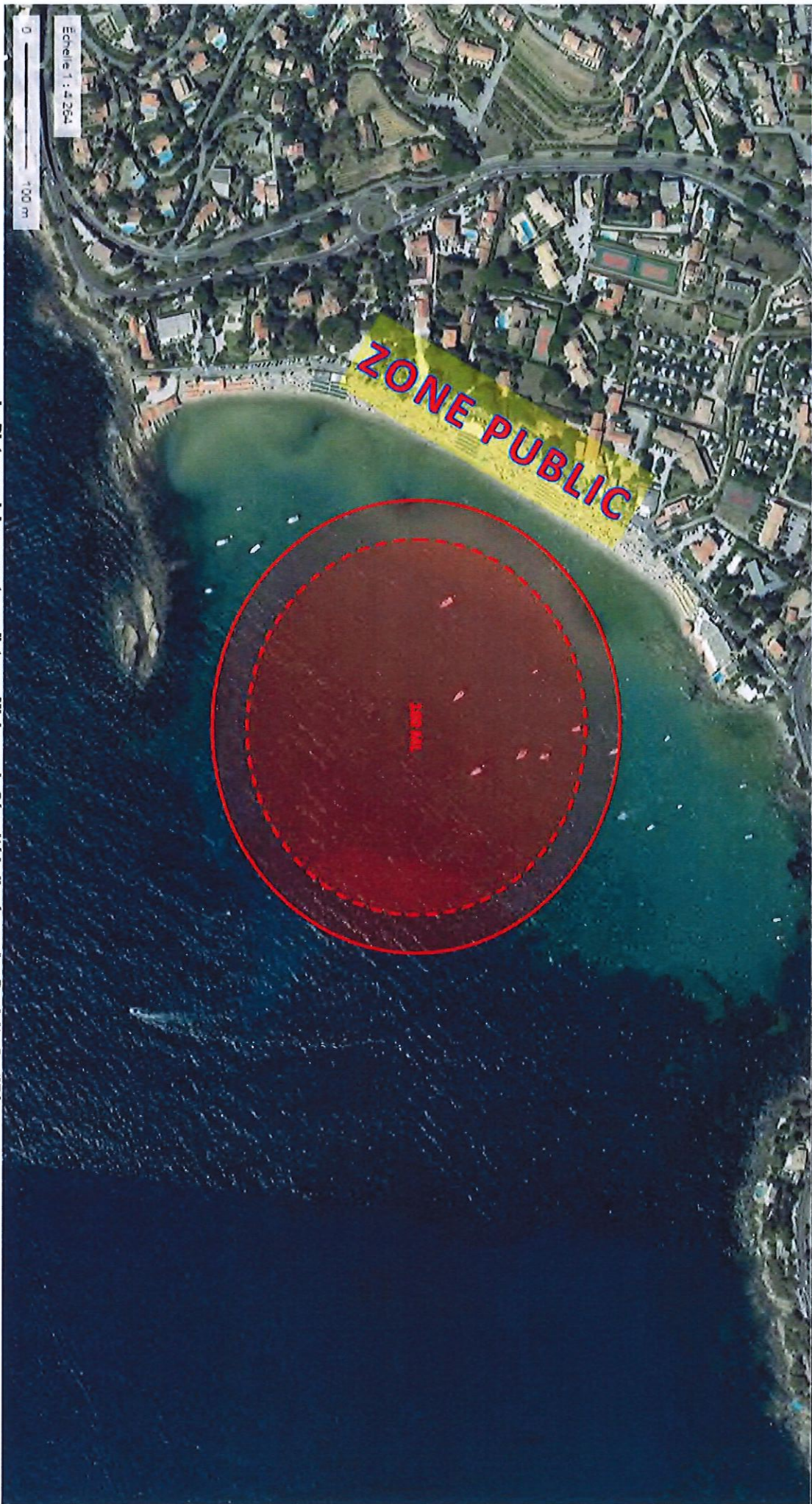
La Distance ci-dessus est une distance Minimum de Sécurité Indiqués sur les Produits Certifiés.